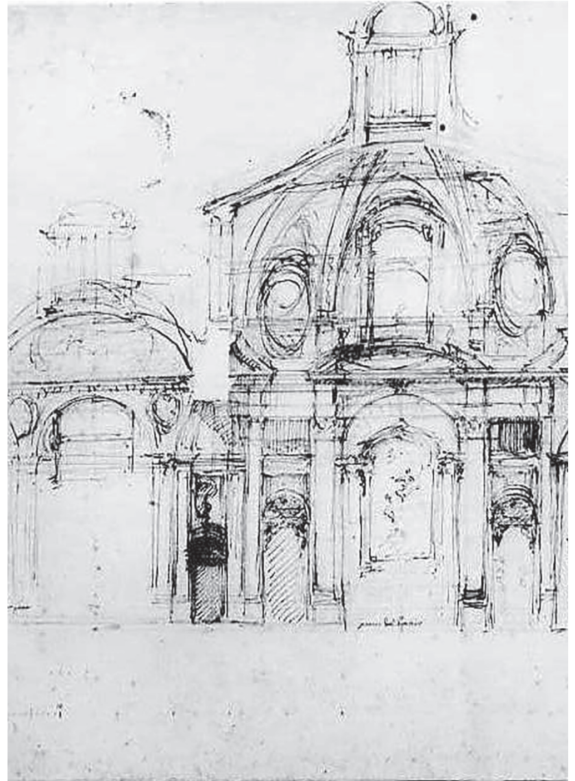
Luigi Vanvitelli (attr.), Sezione della chiesa dei Padri Missionari ai Vergini, 1760 ca. Caserta, Palazzo Reale (Luigi Vanvitelli 2000).