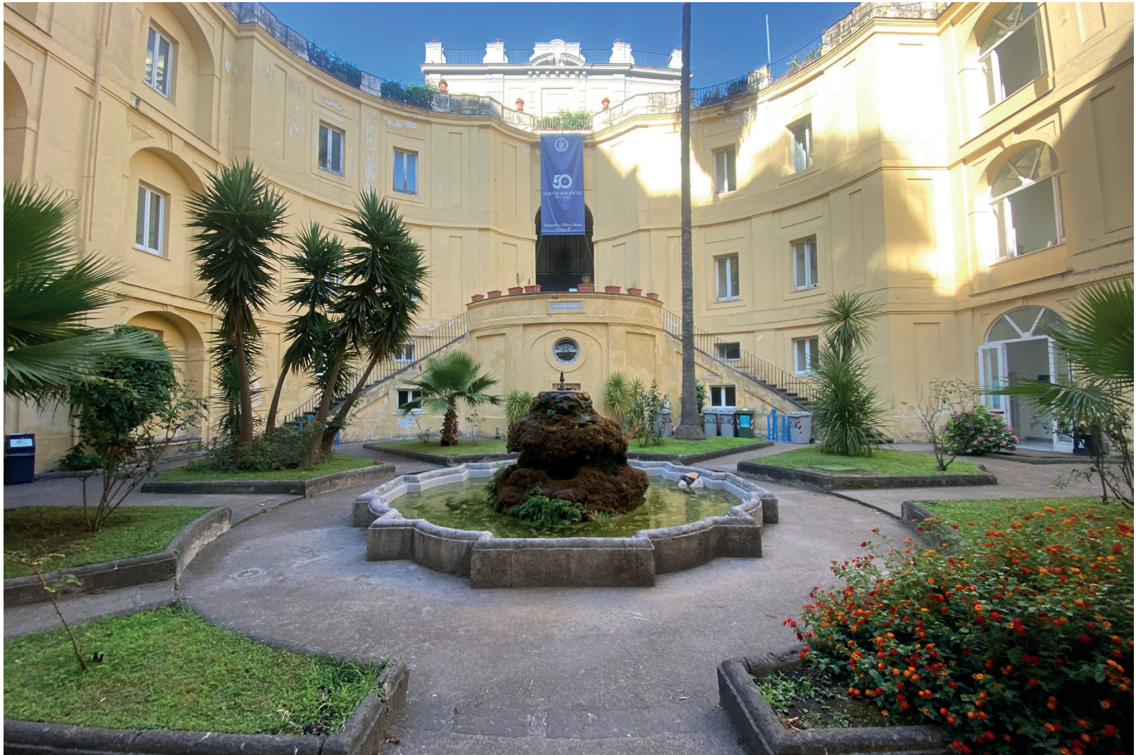
Chiostro inferiore e Oratorio della Scala Santa del Complesso dei Santi Marcellino e Festo.