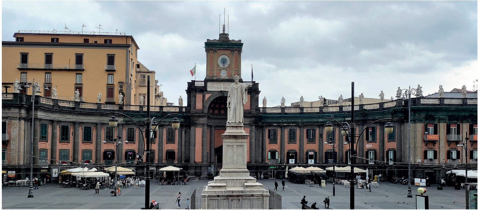
Il Foro Carolino, 2023.