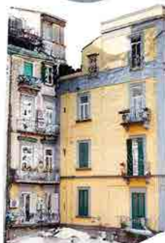
Modelo da Mesh Prospetti b-c