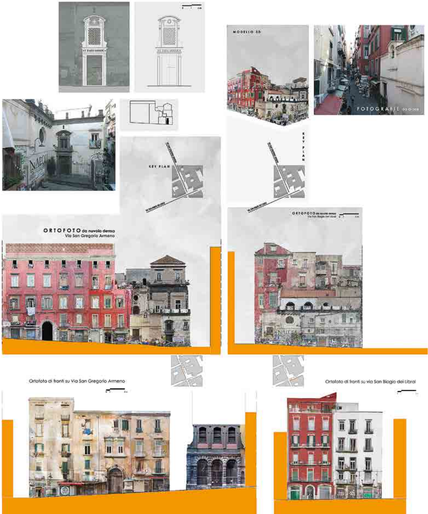
197. L'intersezione di via San Biagio dei Librai, già platea Furcillensis , con l'asse di via Atri-via Nilo-via Paladino (ex platea Atriensis ): composizione dei dati di rilievo (elabor. grafica di Maria Ines Pascariello)