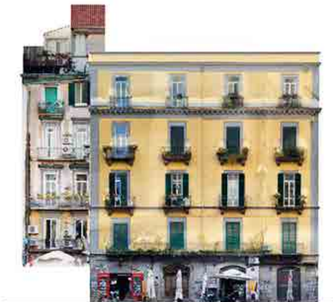
Ortofoto Prospetto a-c