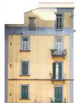
Ortofoto Prospetto b

198. L'incrocio con via San Gregorio Armeno, ex platea Nustriana: composizione dei dati di rilievo (elabor. grafica di Maria Ines Pascariello)