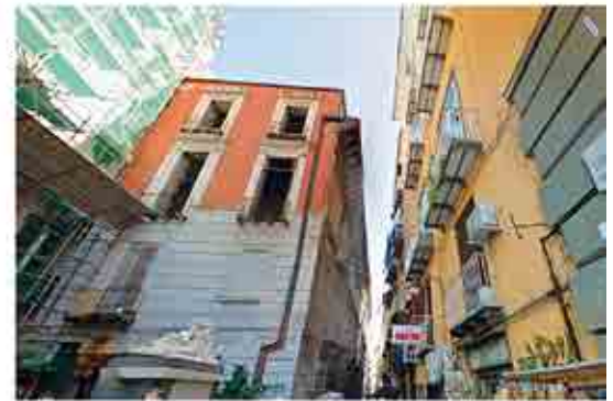
Ortofoto Prospetto f