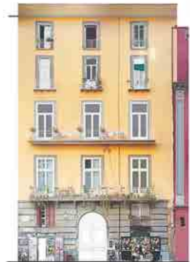
Ortofoto Prospetto d