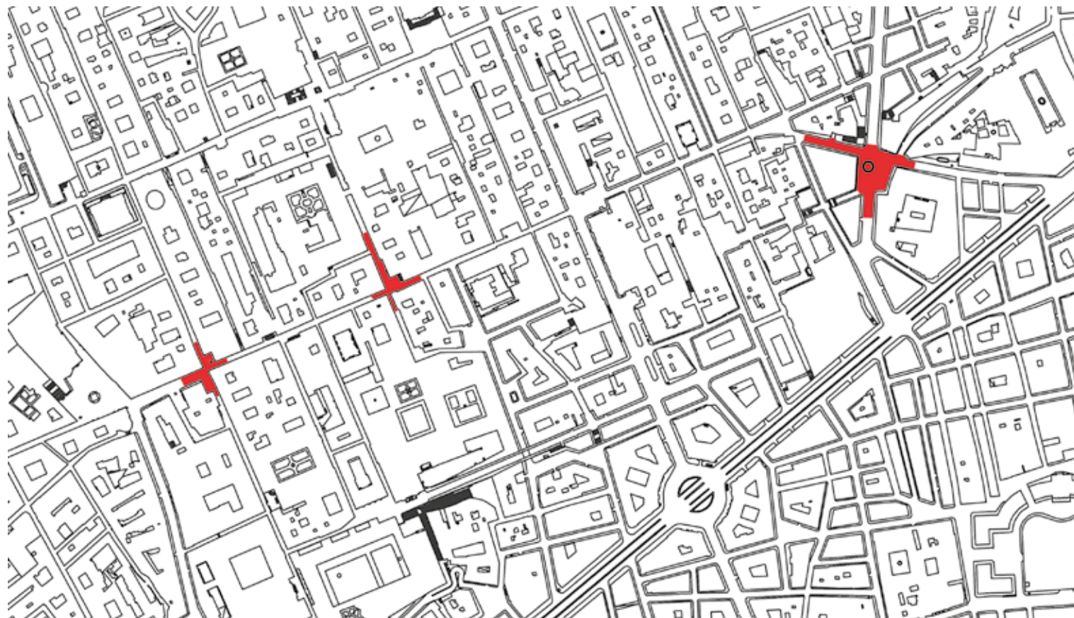
196. Individuazione delle aree oggetto di studio lungo la plateia inferiore (dal DB topografico del Comune di Napoli, 1992)

di via San Gregorio Armeno, già platea Nustriana 14 . Ortogonalmente, su quest'asse si innestano isolati rettangolari le cui dimensioni confermano quelle ricostruite da vari studiosi 15 : il lato lungo pari a 180-185 metri e il lato corto pari a 35-38 metri, in un rapporto proporzionale di 1:5; 5 isolati componevano ciascuno dei 4 quadrati e ogni isolato conteneva al suo interno 20 unità abitative di forma quadrata e di dimensioni pari a circa 17x17 metri. La futura platea Furcillensis – 'Spaccanapoli' – costituisce dunque un elemento strutturale e al tempo stesso visivo fortemente connotativo e chiaramente leggibile tanto in proiezione ortogonale quanto osservando la città antica dall'alto. Prendendo a prestito dalla geometria il termine di 'retta generatrice', con l'accezione di retta che dà origine a una superficie muovendosi nello spazio, risulta particolarmente efficace per sintetizzare il ruolo di elemento creatore assunto nel progetto di fondazione; i fondatori della 'nuova Parthenope', poi Neapolis , dopo essere saliti sul colle di San Martino dal versante sud,