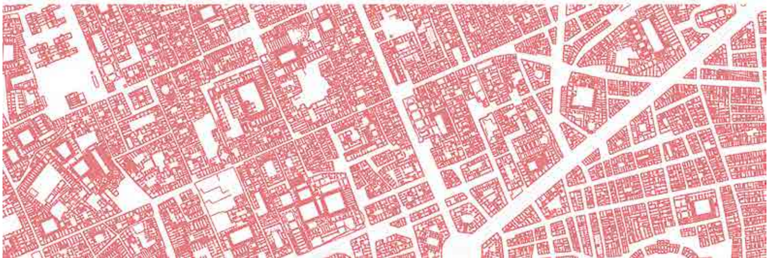
195. La permanenza del tracciato: raffronto dei layer nel Naples Digital Archive relativi alla Mappa topografica della città di Napoli e de' suoi contorni di Giovanni Carafa duca di Noja (1750-1775), al primo catasto geometrico-particellare (1895-1905) e al rilievo tipologico dei piani terra redatto dal Comune di Napoli (Servizio Pianificazione Urbanistica generale e Beni comuni, 2002).