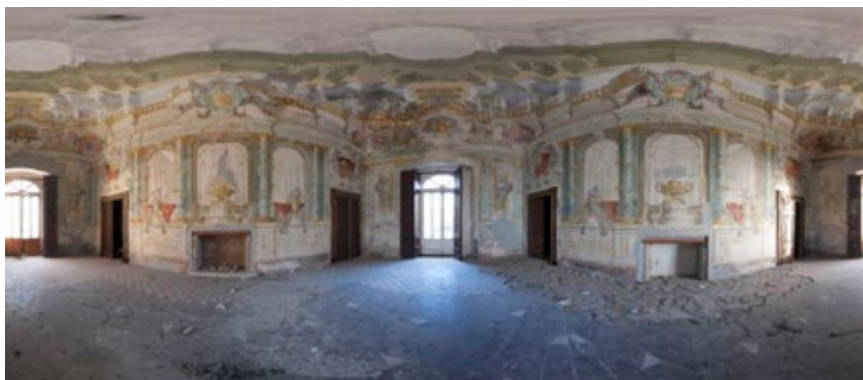
Figura 1. Panorama sferico (proiezione equirettangolare) del salone della Villa del Cardinale (NIKON D60, Focale 8 mm, ISO 100, 17 scatti, dimensione 8000 x 4000 px)