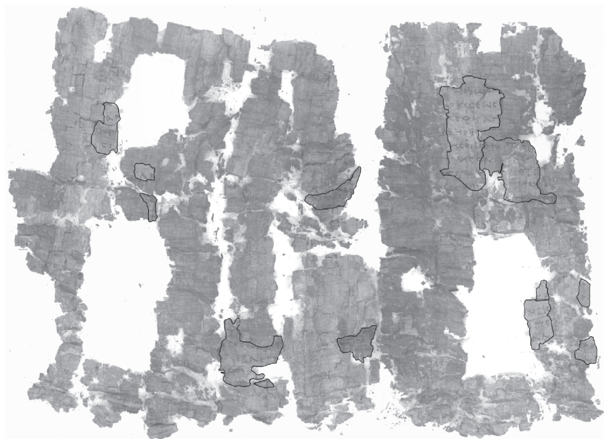
Fig. 4. PHer332, cr 1 pz 1. Agraphon iniziale; sono contornati in nero gli strati sovrapposti

sulle quali si osserva un ampio spazio non scritto, interrotto in alcuni punti da sequenze di testo più o meno estese. L'ispezione della superficie al microscopio ha rivelato che esse appartengono a strati sovrapposti di più livelli: si tratta, cioè, di porzioni di papiro che, durante lo svolgimento meccanico con la macchina di Piaggio, si staccarono dalle volute più interne del rotolo, dove andrebbero virtualmente riposizionate. Ho motivo di credere che quest'ampio pezzo, considerata la sua posizione esterna, sia l' agraphon (o parte dell' agraphon ) iniziale, cioè la porzione non scritta che veniva posta a protezione del titolo iniziale.