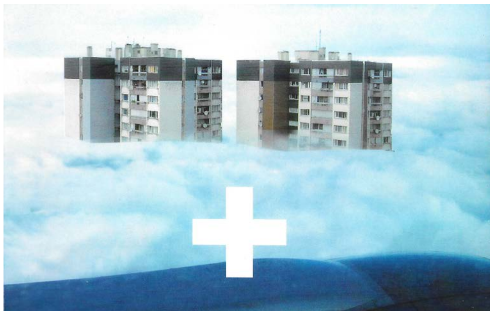
Fig. 5 – Plus. Les grands ensembles de logements. Territoire d'exception

Frédéric Druot, Anne Lacaton e Jean-Philippe Vassal attraverso la loro ricerca Plus , finanziata dal Ministère de la Culture et de la Communication, hanno inteso dimostrare come i costi da prevedere per le demolizioni fossero superiori a quelli da investire per attuare una serie di interventi minimi capaci di apportare un grande plusvalore qualitativo: «Ne jamais démolir, enlever ou remplacer, toujours ajouter, transformer et réutiliser» (Druot et al. , 2007, p. 29) (Fig. 5).