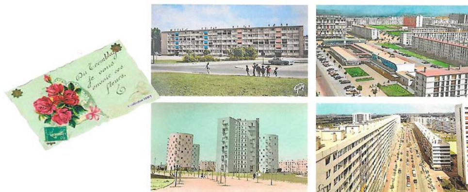
Fig. 3 – Cartoline dai grands ensembles

L'espressione è stata utilizzata la prima volta in un articolo su L'Architecture d'Aujourd'hui del 1935 a firma di Maurice Rotival che ne parlava come «des réalisations de grande envergure (...) qui se veulent de unités résidentielles, équilibrées et complètes» (Rotival, 1935, p. 58). Allo stesso periodo risalgono tutta una serie di immagini, sotto forma di cartoline, diffuse per propagandarle (Fig. 3).