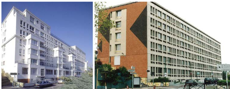
Fig. 7 – Remodelage de la barre Diderot a Argenteuil

In alternativa alla résidentialisation altro modus operandi è dunque quello che Roland Castro, nei suoi lavori per il Grand Paris , ha definito remodelage . Si tratta sostanzialmente di reinterpretare l'architettura degli edifici, lavorare sulle facciate, sui basamenti, aggiungere volumi che possano configurare logge e terrazze, variare gli accessi, articolare e rompere il ritmo ripetitivo dei prospetti, ecc. (Fig. 7). «Il faut éventuellement résidentialiser les grands ensembles, mais cette pratique ne doit pas pour autant se transformer en règle: l'espace public doit être public et le privé, privé. Rien n'est trop beau, rien n'est trop fou, rien n'est trop jubilatoire. Au contraire, plus ces quartiers deviennent attractifs, plus ils sont un appel à l'autre et mieux ils se portent : la belle métamorphose a le droit à la carte postale». (Castro et al. , 2013, p. 142).