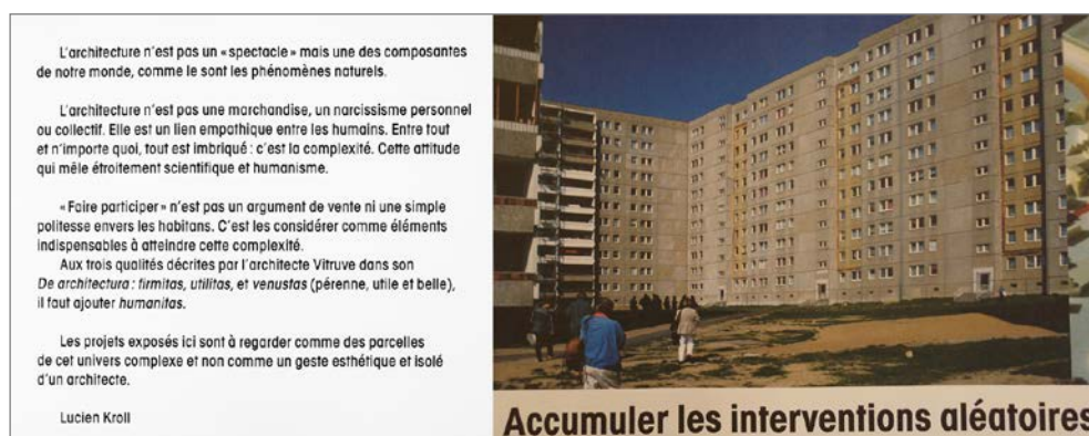
Fig. 8 – Esposizione Tout est paysage, une architecture habitée (Paris, 2015)

Kroll, a partire dalla fine degli anni settanta, intraprende il suo percorso di ricerca sul progetto sostenibile come processo partecipativo sperimentando differenti progetti di trasformazione degli spazi collettivi di alcuni grands ensembles belgi, francesi e tedeschi, esposti nella sezione della mostra intitolata Réparer le désastre , quali: la Réhabilitation de la ZUP Perseigne, Alençon (Francia 1978), la réhabilitation d'une barre de 30 mètres de long Amiens-Etouvie (Francia 1984), la réhabilitation de HLM, Clichy-sous-Bois (Francia 1985) e di una barre de 40 logements a Bethoncourt, Montbéliard (Francia 1990); a questi ne sono seguiti vari altri sino al più recente progetto per Berlin-Hellersdorf, Germania 1994.