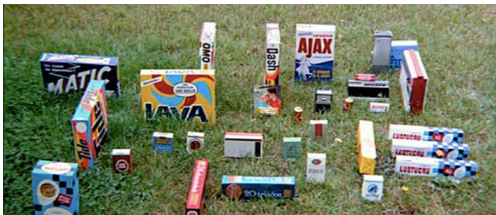
Fig. 1 – I grands ensembles : un “prodotto” per il consumo di massa