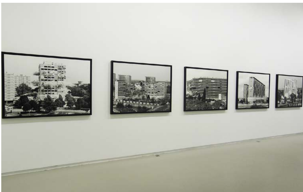
Fig. 4 – Lo "spettacolo" delle demolizioni

Fonte: Fotografia di O. Fatigato, Esposizione di M. Pernot, La traversée (Jeu de Paume, 2014)