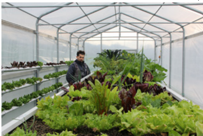
2. Ente X4, Impianto acquaponico, 2023

Ponendo quindi come temi al centro della proposta progettuale: La natura come prodotto progettato; la natura come esito della artificializzazione spinta dell'ambiente; la tracciabilità del confine tra natura e artificio come risultato del processo tecnologico avanzato; la macchina e la fabbrica come produttori di qualità ambientale; la naturalità come qualità progettabile del prodotto industriale (p. 104).