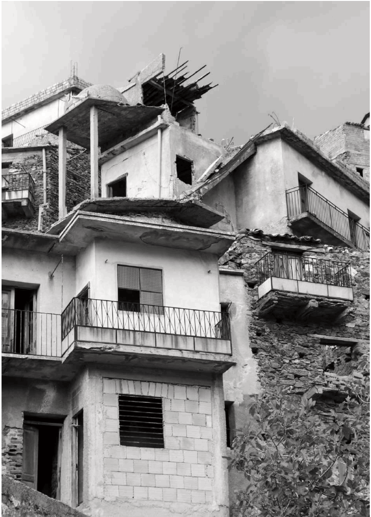
Figura 3. Palinsesti. Sovrapposizione e cancellazione di strati e segni antropici a Roghudi, Città Metropolitana di Reggio Calabria.