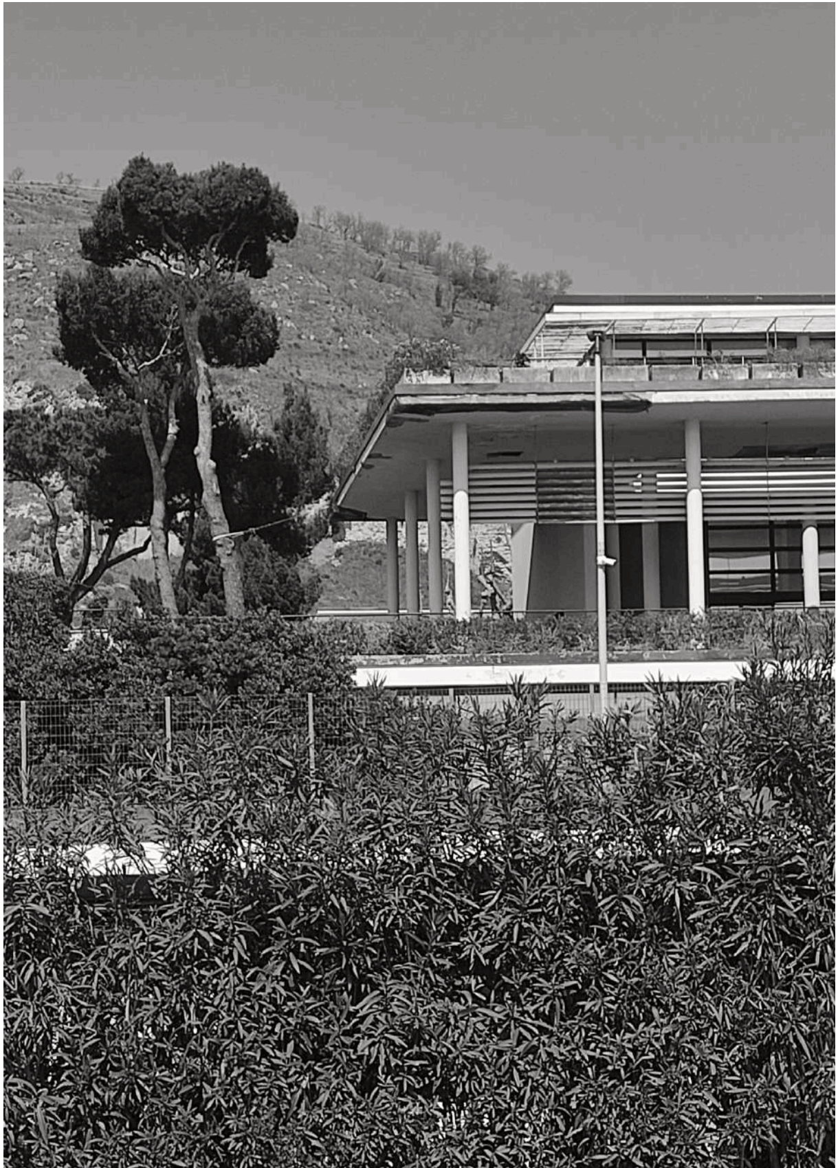
Figura 5. Officine Olivetti . Progetto di Cosenza e Porcinai, la sequenza paesaggistica giardino/architettura/collina, Pozzuoli, Città Metropolitana di Napoli.