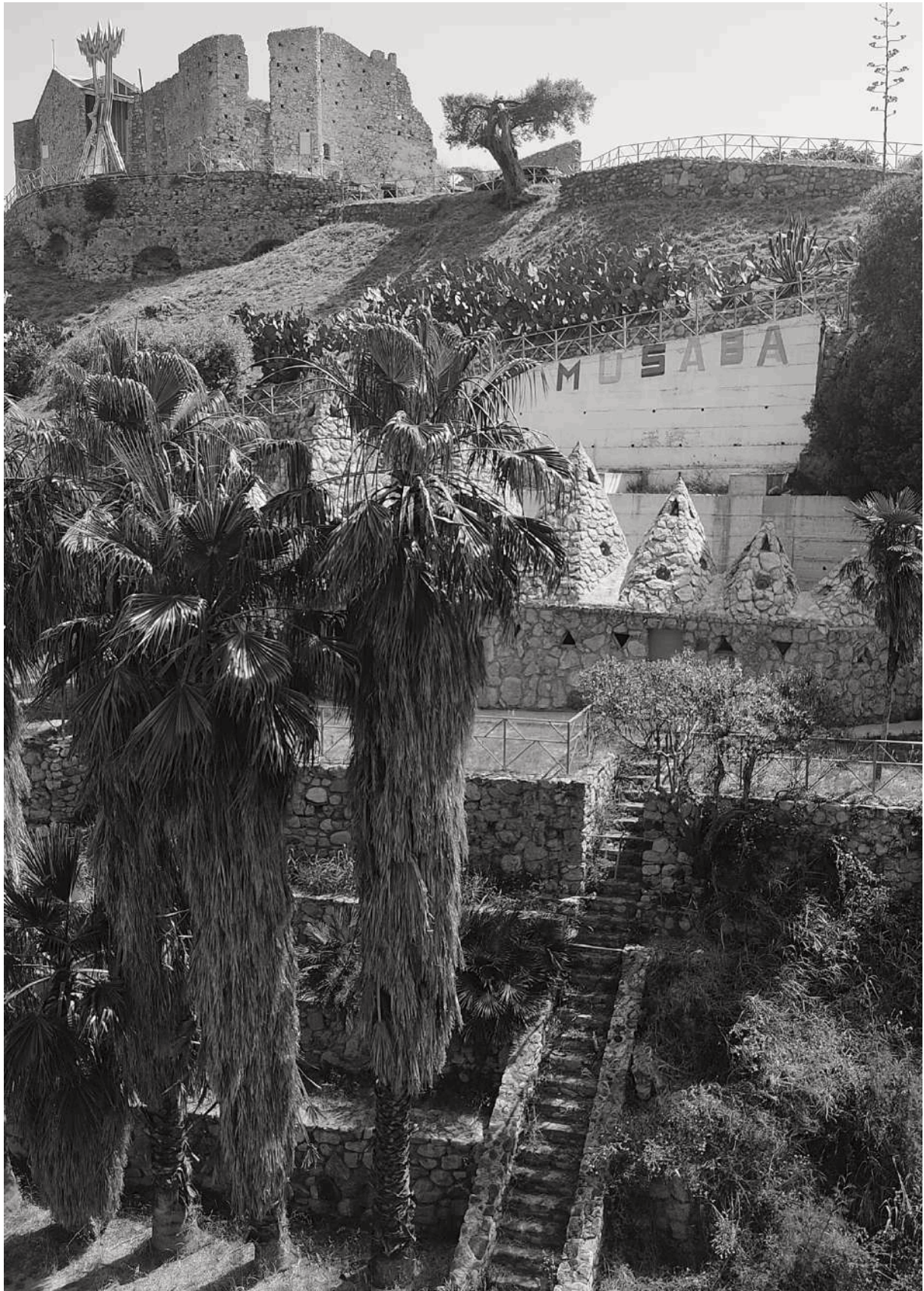
Figura 17. MuSaBa . Il Parco Museo di Santa Barbara costruito dall'artista Nik Spatari nel corso di tutta la sua vita, Mammola, Città Metropolitana di Reggio Calabria.

Fonte: Giofrè V. (2022), Atlante Fotografico Paesaggi a Mezzogiorno .