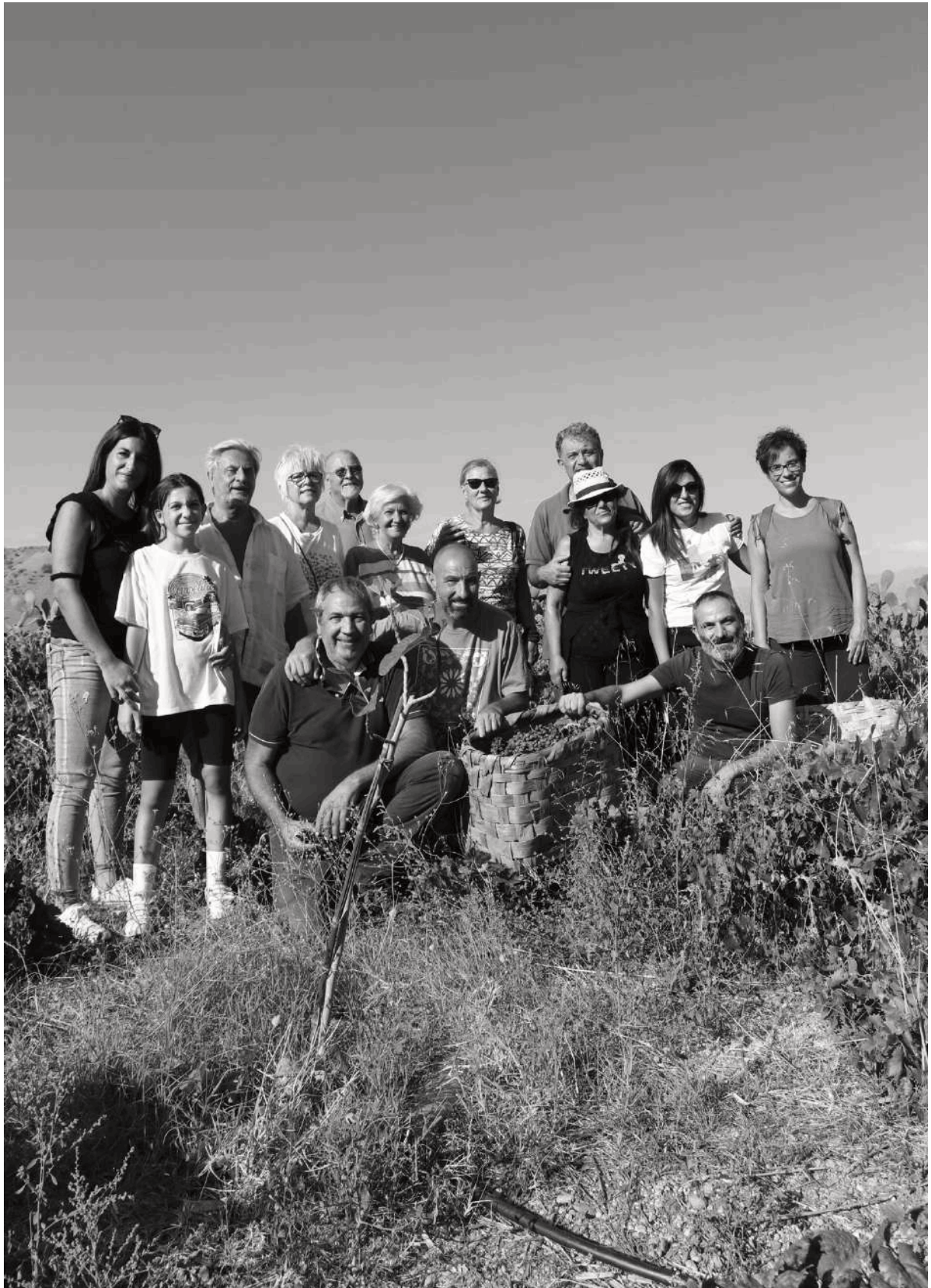
Figura 15. La comunità ACE di Pellaro. In posa dopo la vendemmia nel terrazzamento del Parco Diffuso della Conoscenza e del Benessere, Città Metropolitana di Reggio Calabria.