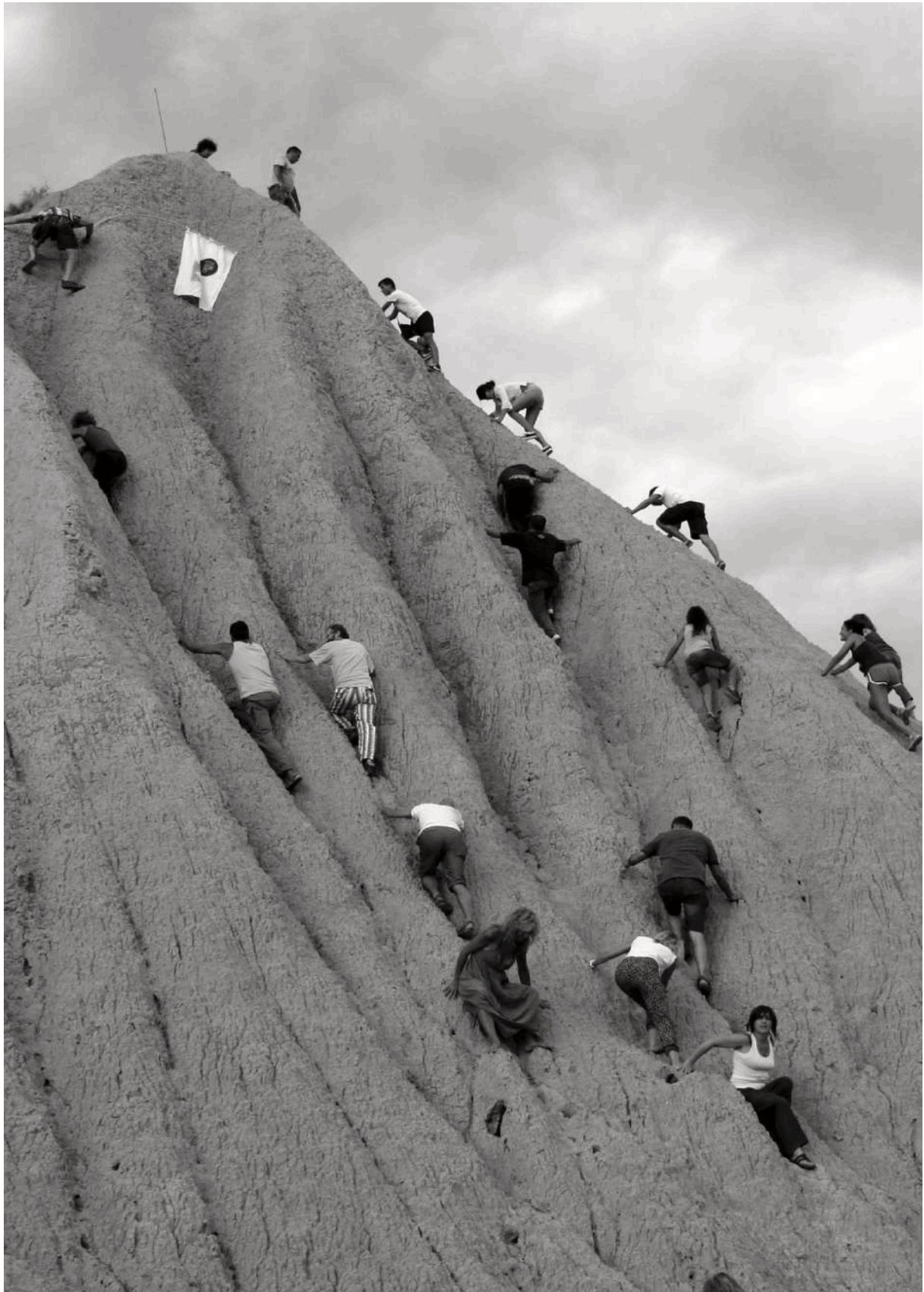
Figura 16. La scalata dei calanchi . Giornata inaugurale del festival La Luna e i Calanchi , performance dei partecipanti alla manifestazione che si arrampicano su uno dei calanchi, Aliano, Matera.