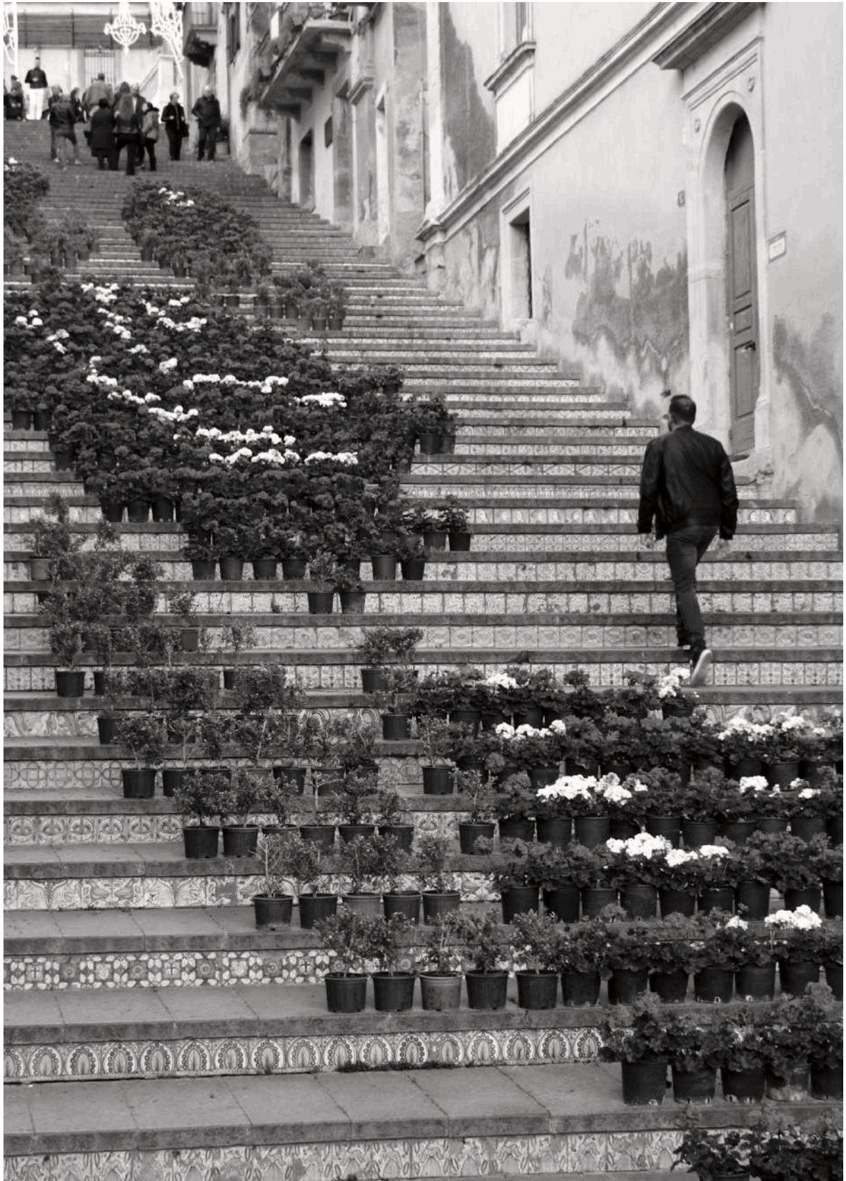
Figura 10. I gerani di Caltagirone. L'infiorata sulla scala monumentale promossa dall'Amministrazione comunale e curata dai cittadini, Caltagirone, Città Metropolitana di Catania.