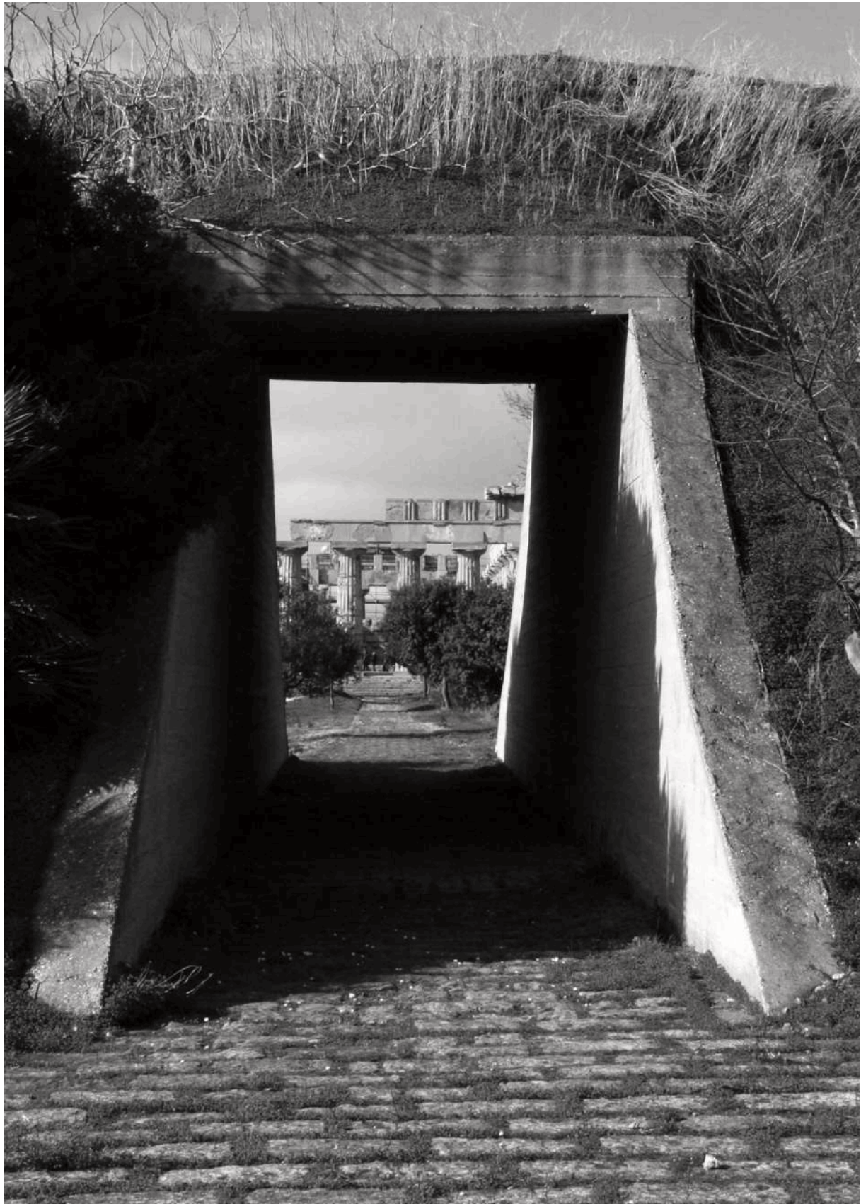
Figura 6. Parco Archeologico di Selinunte . Uno dei varchi di accesso del tridente progettato da Porcinai e Minissi, Selinunte, Trapani.