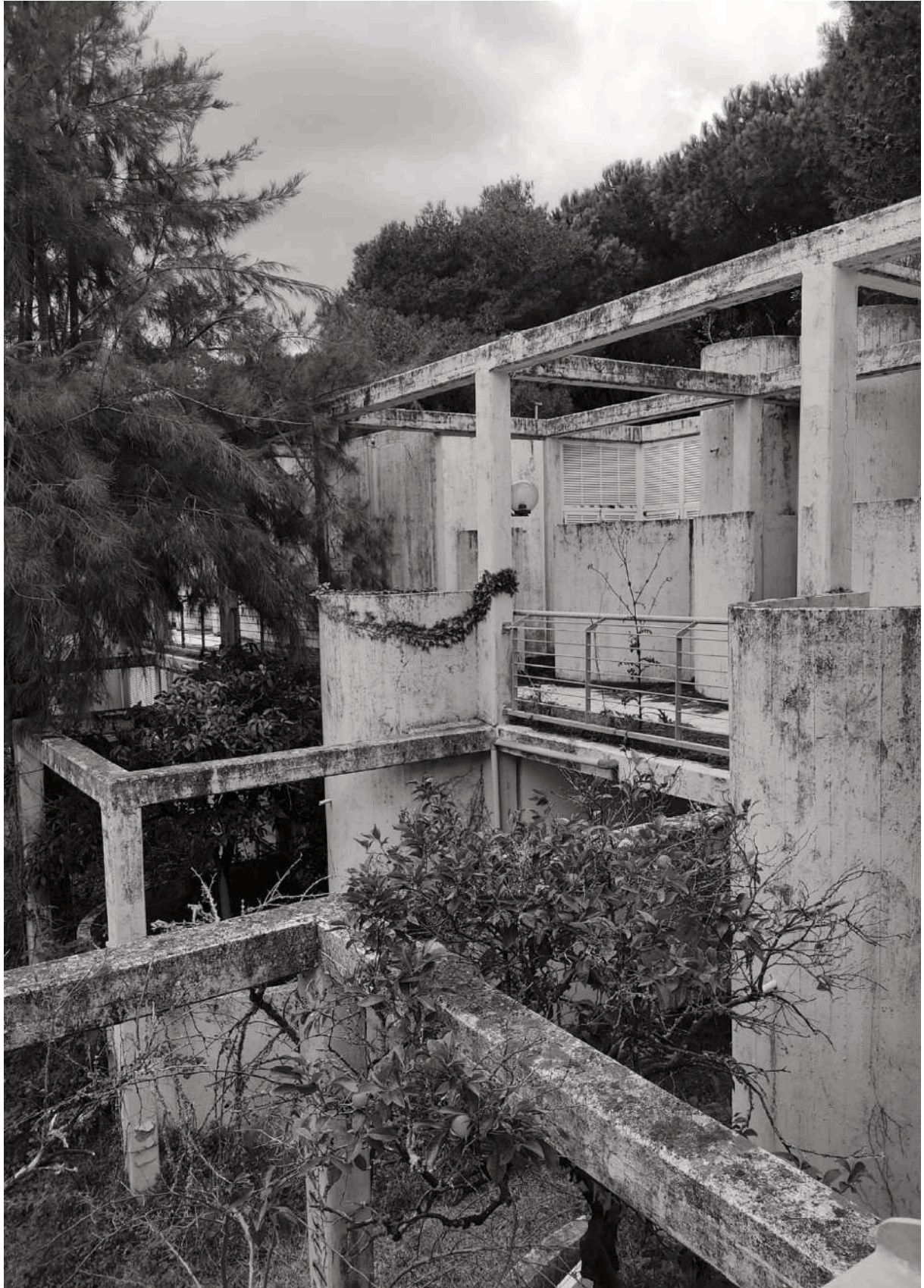
Figura 7. Villaggio Turistico Valtur a Nicotera. Progetto Porcinai e Cidonio. In primo piano un giardino di agrumi, dietro la pineta a protezione dell'insediamento, Nicotera, Vibo Valentia.