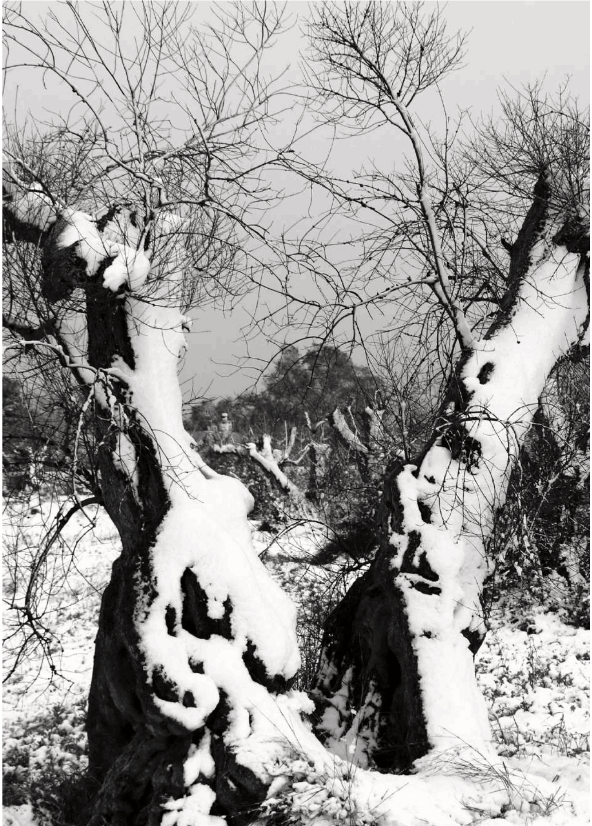
Figura 8. Ulivi del Salento. Gli ulivi già colpiti dalla Xilella ricoperti da un'inusuale nevicata invernale, penisola salentina, Lecce.