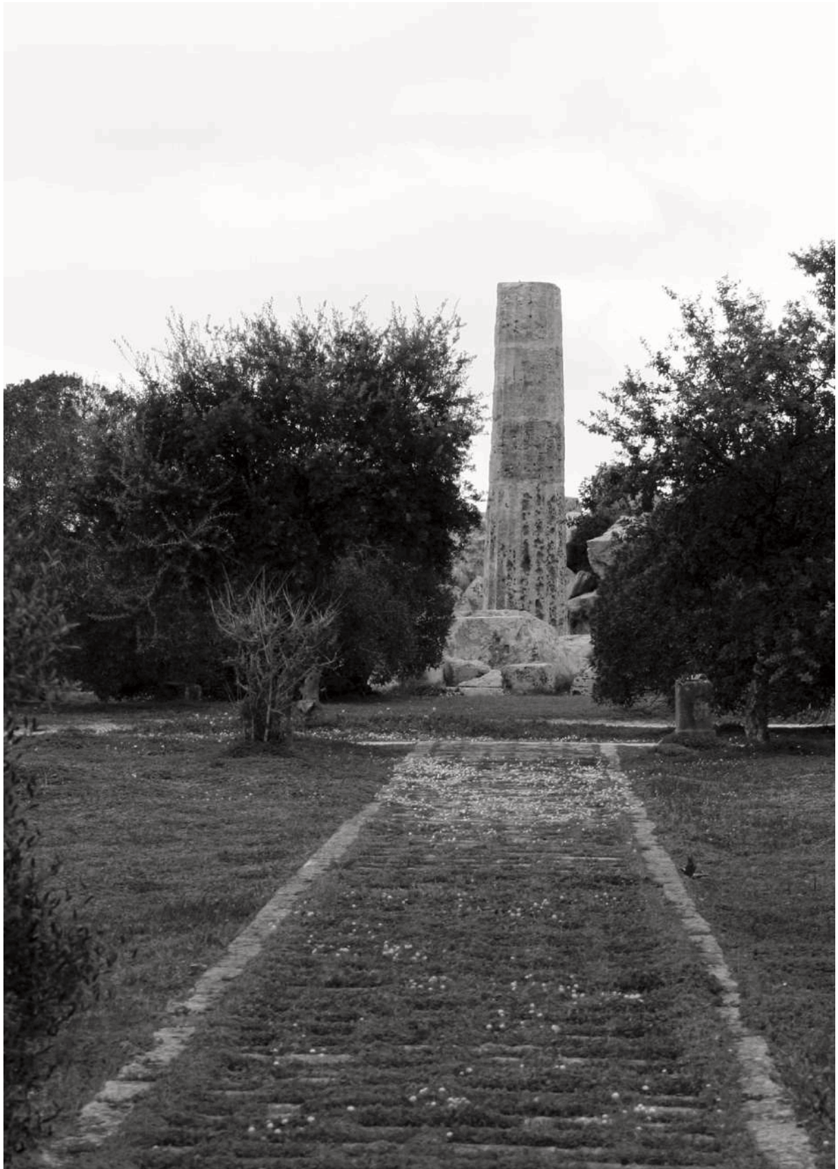
Figura 4. Parco Archeologico di Selinunte. Progetto di Porcinai e Minissi, uno dei percorsi che conduce ai resti dei templi, Selinunte, Trapani.