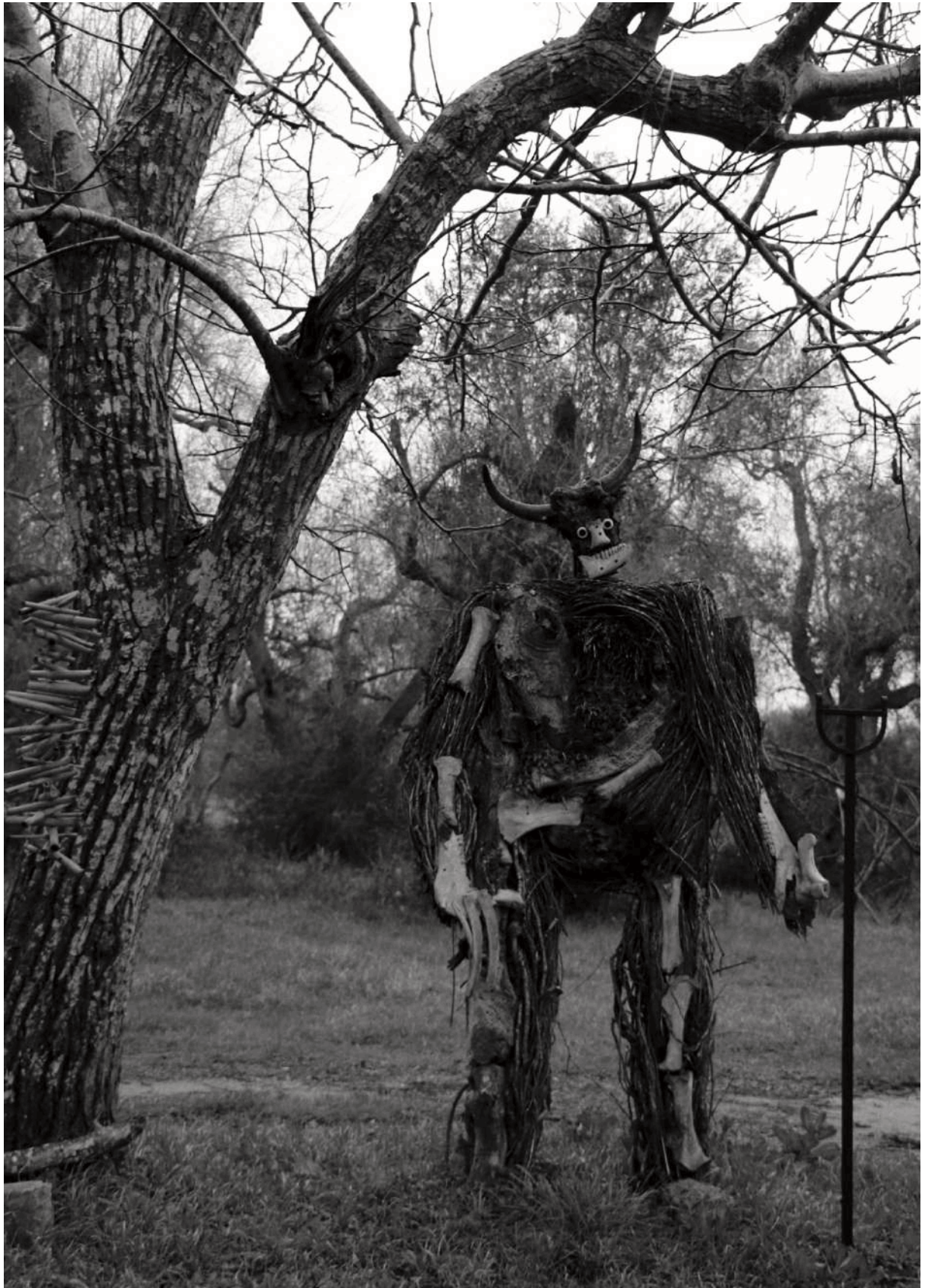
Figura 12. Multifunzionalità . Una delle creature dei Paduli si aggira misteriosamente tra gli ulivi secolari del Parco dei Paduli , penisola salentina, Lecce.