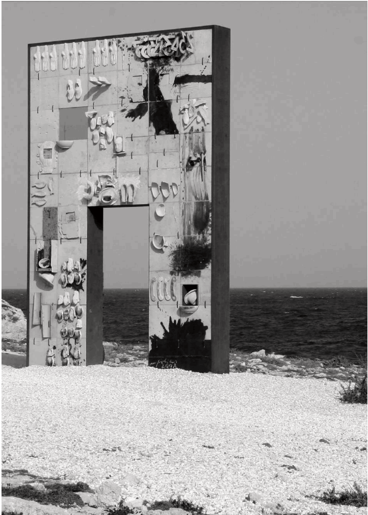
Figura 2. La porta d'Europa, opera di Mimmo Paladino, tributo ai migranti morti in mare nel tentativo di raggiungere l'Europa, Lampedusa, Agrigento.