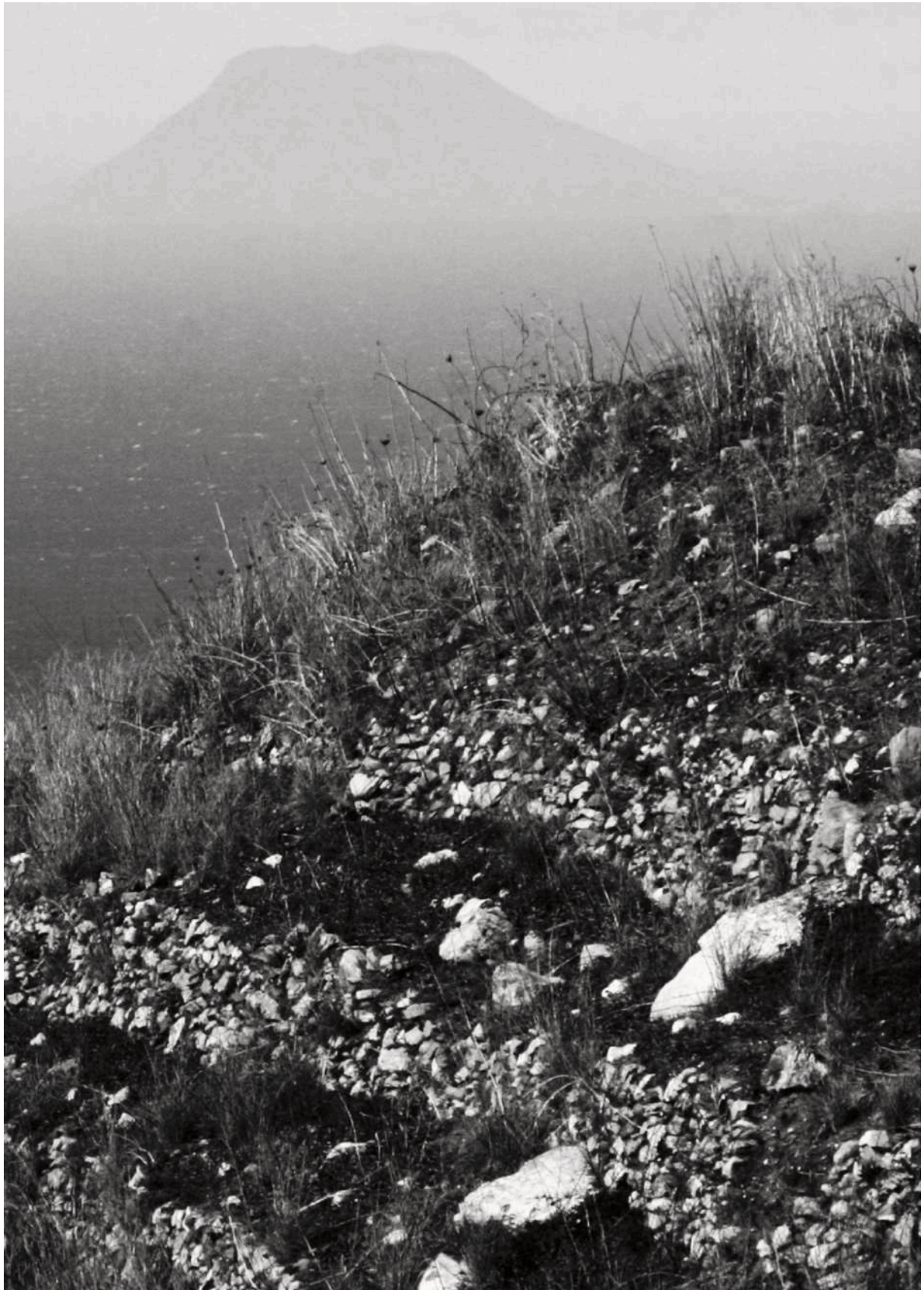
Figura 18. Il Faro del Mediterraneo . In primo piano un terrazzamento abbandonato della Costa Viola, sullo sfondo Stromboli, Città Metropolitana di Reggio Calabria.