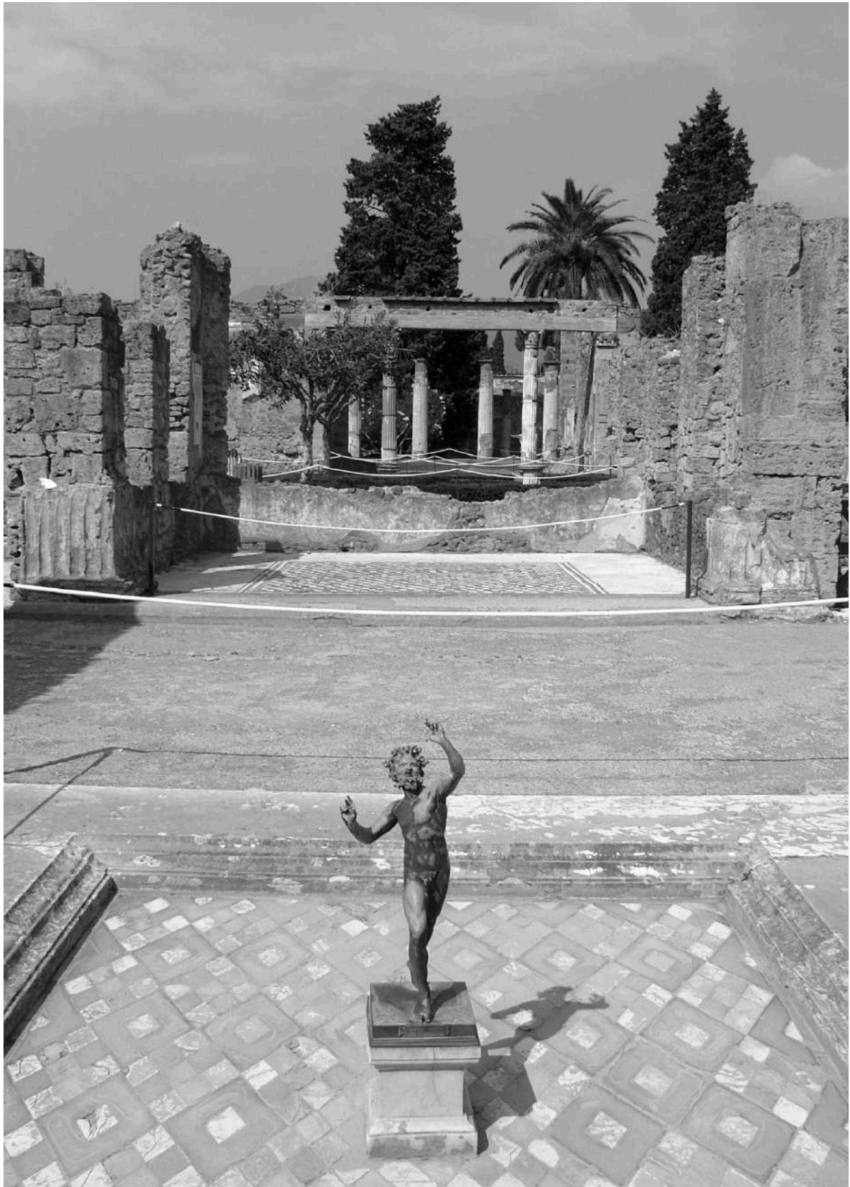
Figura 1. La casa del Fauno. L'area archeologica di Pompei è un Paesaggio di eccellenza rappresentativo dell'identità nazionale, Pompei, Città Metropolitana di Napoli.