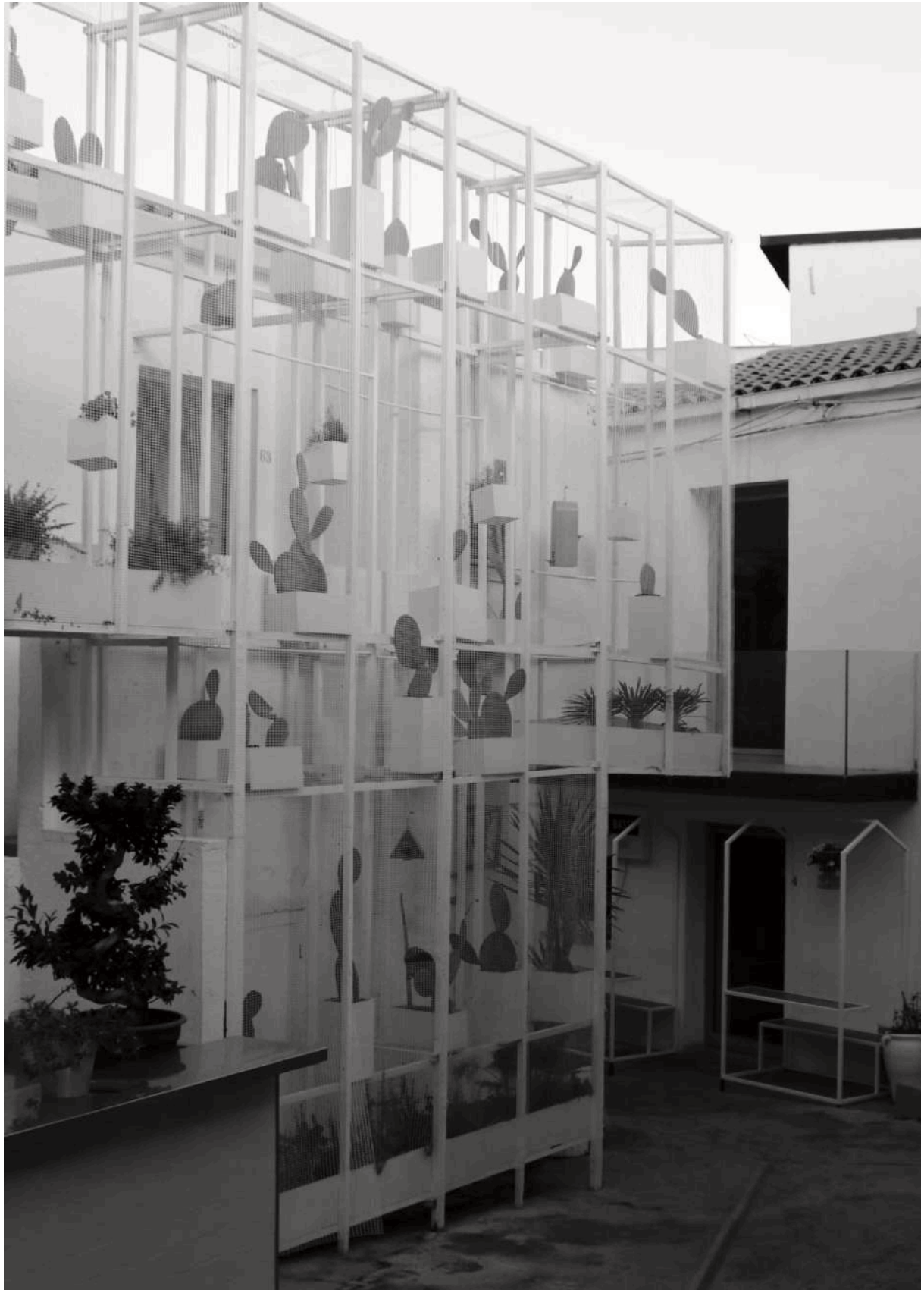
Figura 13. Rinascite . Una seconda pelle realizzata con materiali di recupero per uno degli edifici riabilitati nel Farm Cultural Park , Favara, Agrigento.