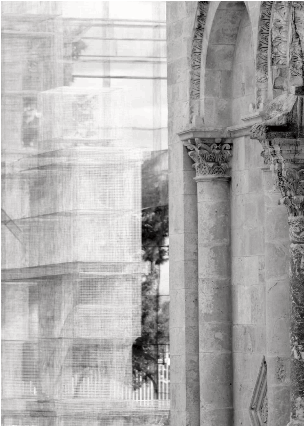
Figura 11. Sovrascritture. In primo piano la Basilica Romanica di S. Maria Maggiore, dietro l'installazione Dove l'arte ricostruisce il tempo di Edoardo Tresoldi, Manfredonia, Foggia.

Fonte: Giofrè V. (2022), Atlante Fotografico Paesaggi a Mezzogiorno.