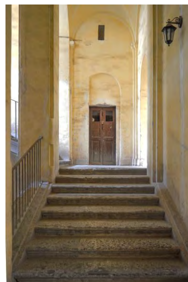
1: L'accesso alla scala di Palazzo di Ludovico di Bux, Palazzo di Nerone, Palazzo Mosca.