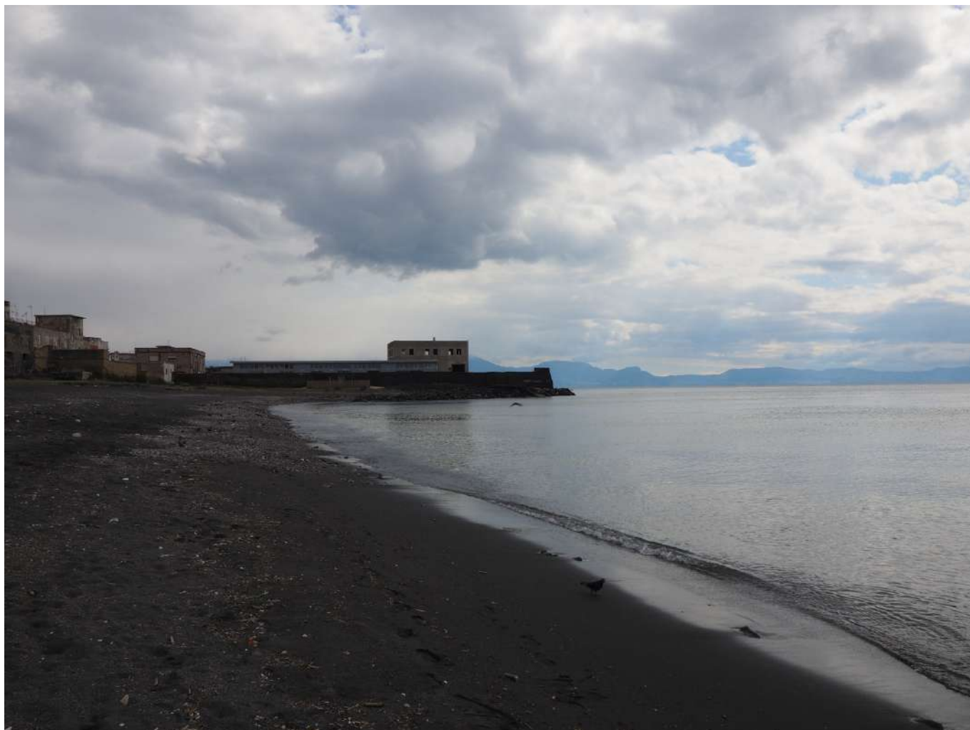
(Fig. 2) La Spiaggia di Vigliena a San Giovanni a Teduccio, Napoli. Foto di Michelangelo Russo, 2022.

come simbolo del degrado ambientale e sociale) 9 . Ripristinare l'equilibrio ambientale è un obiettivo della pianificazione che agisce direttamente sul metabolismo attraverso un progetto capace di gestire i flussi di waste , per minimizzarne la produzione, sostenerne la riduzione e il riciclo, rigenerare il territorio, facendo ricorso al paradigma dell'economia circolare 10 .