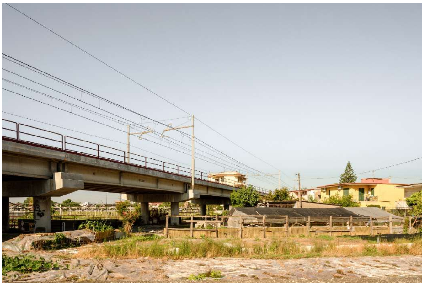
(Fig. 1) Wastescape . Napoli, Ponticelli - Fotografia di Mario Ferrara, 2021. Dalla campagna fotografica condotta per il programma di ricerca EcoRegen del DiARC.

elaborazione presso il Dipartimento di Architettura di Napoli, guarda alla dimensione dello scarto, nella sua accezione più ampia di spazio-risorsa , come possibile tema da indagare e approfondire per comprendere la spazializzazione del metabolismo e valutarne gli impatti territoriali al fine di promuovere una rigenerazione in chiave circolare.