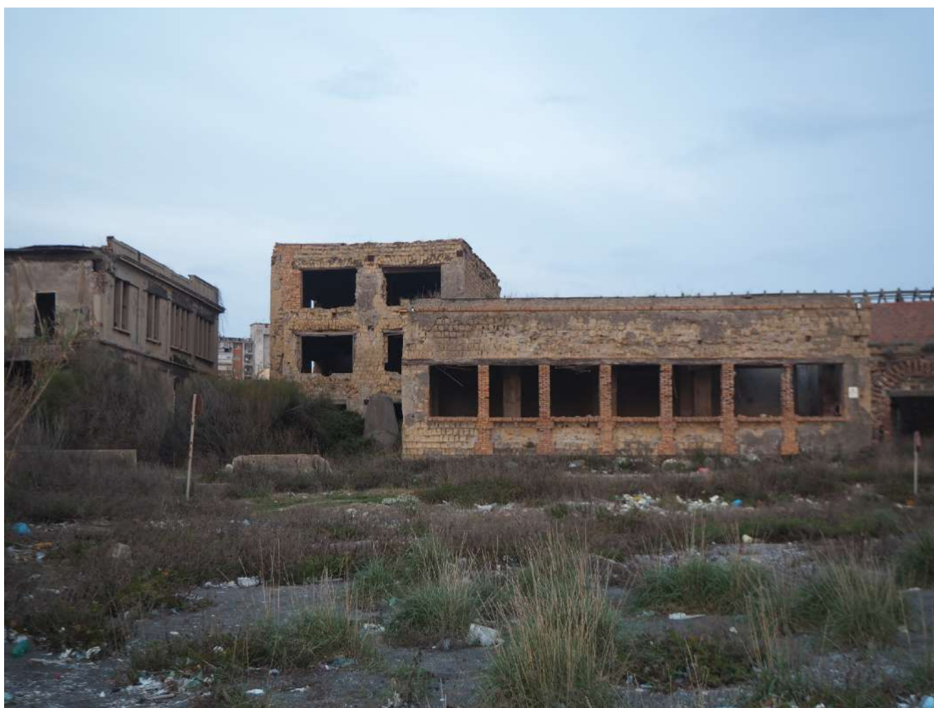
(Fig. 1) Ex Industria dismessa Corradini-De Simone. Il fenomeno della dismissione industriale lungo la costa di San Giovanni a Teduccio, Napoli.

rigenerare la continuità dei valori ambientali dei contesti. La quota di progetto paesaggistico e ambientale nelle azioni di recupero delle aree dismesse degli anni '80 e '90, era incentrata sulla realizzazione di interventi puntuali (parchi, giardini, spazi aperti pubblici etc.) tuttavia non necessariamente inquadrati in una visione di insieme delle relazioni eco-sistemiche attivabili in tali processi rigenerativi. Dunque, l'ecologia, sembrava quasi un'attenzione relegata alla produzione di un sistema di spazi accessori dei grandi interventi di rinnovamento degli edifici dismessi, ovvero come una sommatoria di interventi isolati e circoscritti che, in definitiva, rischiava di rappresentare una opzione aggiuntiva di grandi operazioni di sviluppo immobiliare, non sempre improntata ad un necessario approccio olistico e sistemico.