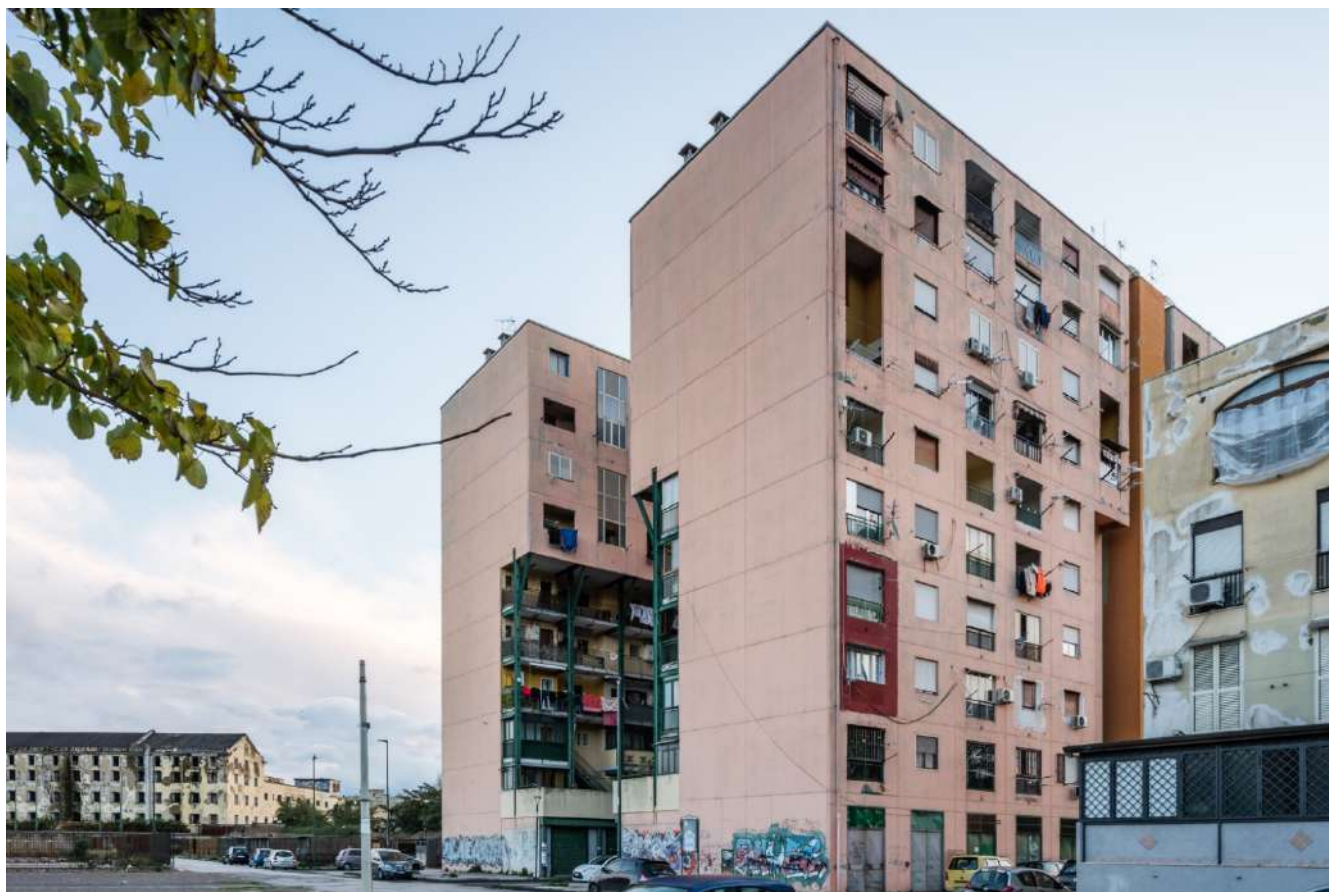
(Fig. 3) Il rione Pazzigno. Napoli, San Giovanni a Teduccio - Fotografia di Mario Ferrara, 2021. Dalla campagna fotografica condotta per il programma di ricerca EcoRegen del DiARC.

potenziale di spazio pubblico e infrastruttura collettiva di riequilibrio della città. Il recupero e la bonifica dei suoli inquinati sono azioni da considerare come applicazione possibile dell'economia circolare al territorio per la rivitalizzazione dei flussi eco-sistemici. Infine, la gestione e il riciclo dei flussi di waste, in particolare quello relativo al Construction and Demolition , può considerarsi un dispositivo utile alla rigenerazione in termini di produzione di materie prime-seconde, da riutilizzare per la riconfigurazione morfologica del riuso, di nuovi assetti dello spazio attraverso l'istituzione di filiere-corte, con il trattamento e il riutilizzo dei materiali in loco, o attraverso l'individuazione di siti di stoccaggio ben integrati alla città prossimi all'area di intervento per ridurre l'impatto di tali flussi di scarto sul territorio.