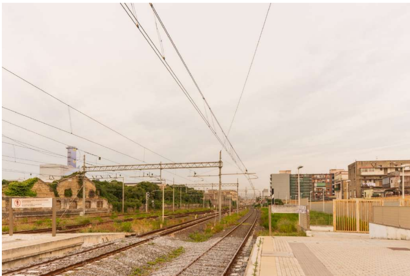
(Fig. 2) La Ferrovia come cesura tra il sistema costiero e l'entroterra. Napoli, San Giovanni a Teduccio - Fotografia di Mario Ferrara, 2021. Dalla campagna fotografica condotta per il programma di ricerca EcoRegen del DiARC.

questi quartieri hanno perso la loro forza ed appaiono luoghi fragili, sospesi, vuoti (Gabellini, 2018). La dimensione infrastrutturale intimamente legata a quella insediativa compromette dunque irrimediabilmente quella ecologica, attraverso la definizione di rischi antropici connessi ai modi di costruire ed infrastrutturare le città: dai rischi idrogeologici a quelli connessi al consumo di suolo, all'inquinamento di acqua e aria, ai rischi connessi al microclima e all'impoverimento eco-sistemico.